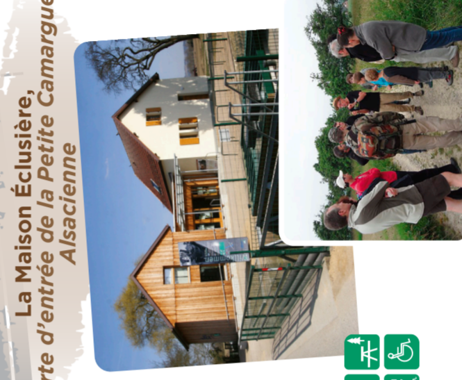
La Maison Écluisière, porte d'entrée de la Petite Camargue Alsacienne

expositions «Mémoire du Rhin» et «Mémoire de Saumon».