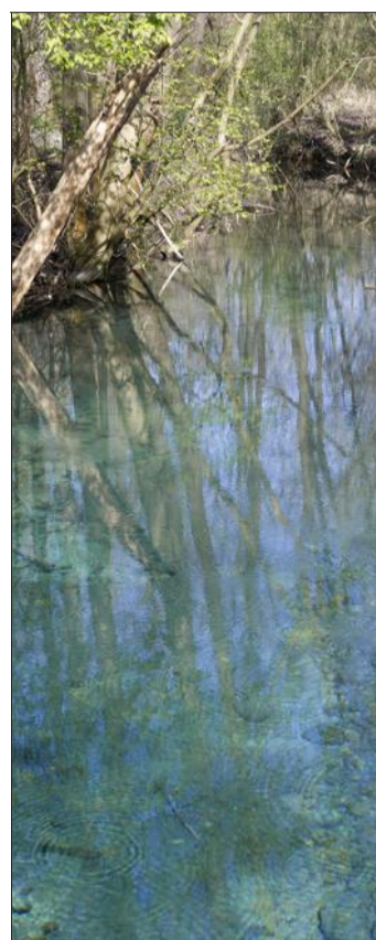
Les sources phréatiques aux eaux bleues étonnantes.