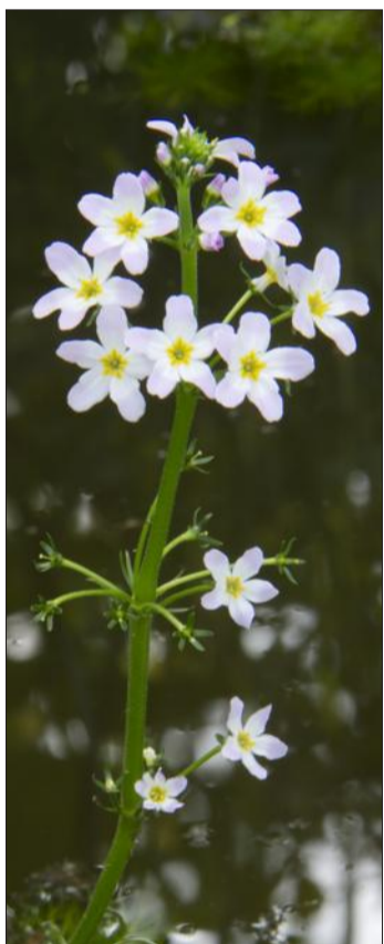
Une hottonie des marais - un des trésors de la Petite Camargue.