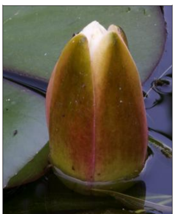
Toute la beauté d'un nénuphar qui s'ouvre.